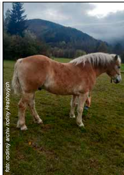
Fotografie ukazují koňskou ohánku před trestným činem a po něm

Ač zloděj zvířeti přímo fyzicky neublížil, kvůli nedostatečně dlouhé ohánce se nebude moci bránit přirozeným cizopasníkům, jako jsou (mouchy a komáři) po dobu x let. Koňský ohon dorůstá osm až devět centimetrů za rok. To znamená, že do původní délky naroste za osm až devět let. Tímto bych chtěl upozornit vlastníky všech zvířat na drzost a bezohlednost takových zlodějů!