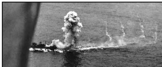
Alsterufer těsně po zásahu bombami vyfocen z paluby Liberatora

Loď plula z Asie za přísného utajení. Dodržovala rádiové ticho, ale britská Admiralita díky prolomení šifry Enigma a čtení zpráv Kriegsmarine (= německé válečné námořnictvo) o plavbě věděla. Ale Atlantik je rozlehlý a najít v něm plavidlo je pověstné hledání jehly v kupce sena. Ale Britové měli štěstí, 27. prosince spatřila osádka létajícího člunu Sunderland časně ráno plavidlo a oznámila jeho