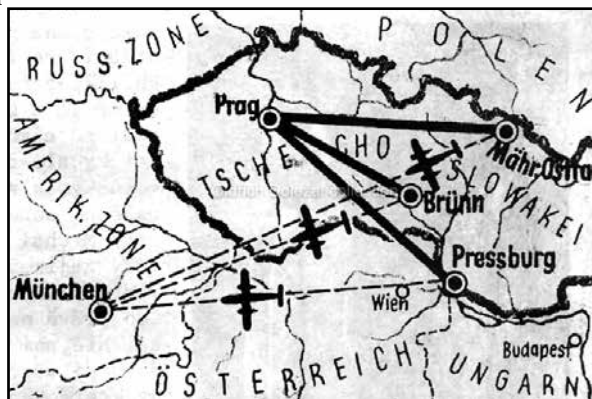
mapa „Erding Escape“