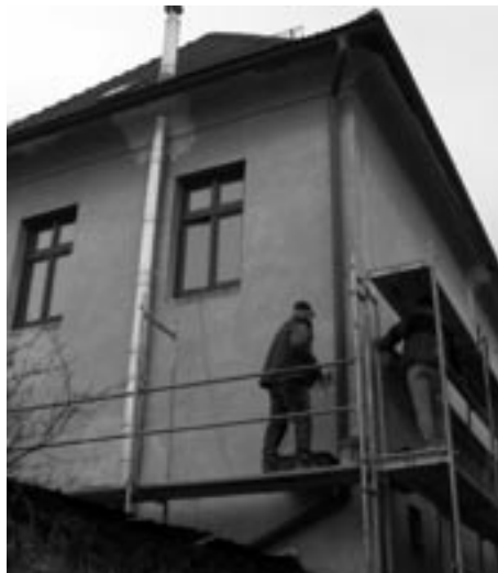
Při rekonstrukci fary

Svatým týdnem si připomínáme poslední dny Ježíšova života, které začaly jeho slavným vjezdem do Jeruzaléma, jak si přibližujeme o Květné neděli. Ve čtvrtek slavíme památku poslední velikonoční večeře, kterou Ježíš prožil se svými apoštoly a vědomě se daroval jako oběť lásky za spásu člověka. Po této večeři Ježíš odchází do Getsemanské zahrady, kde se modlí a očekává svého zrádce Jidáše. Na Velký pátek si připomínáme Ježíšovo odsouzení a jeho ukřížování. V sobotu se chodíme modlit k Božím hrob, protože Ježíš byl v pátek pohřben a sobota je dnem, kdy ležel v hrobě. Neděle