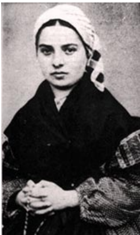
Bernadetta Soubirousová