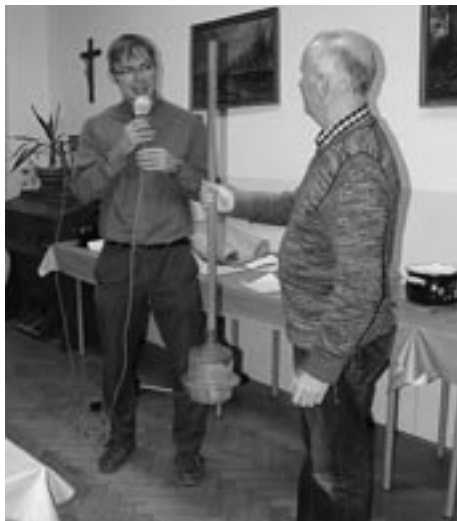
Při setkání s farníky ve staré škole na Kopané