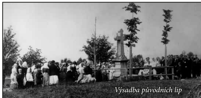
Výsadba původních lip