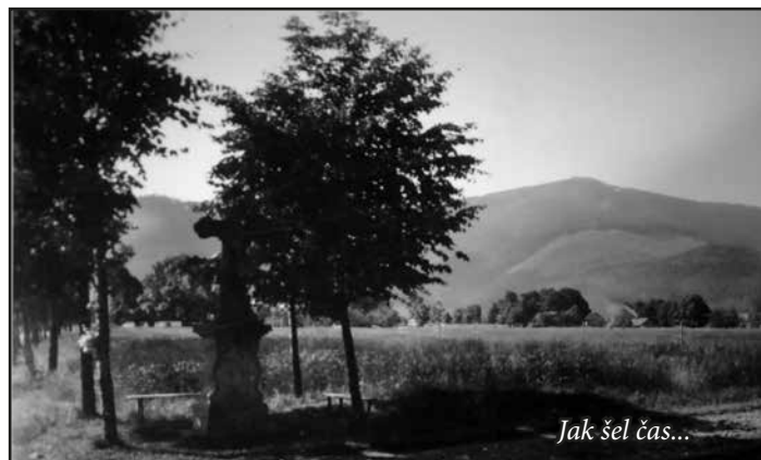
Jak šel čas...