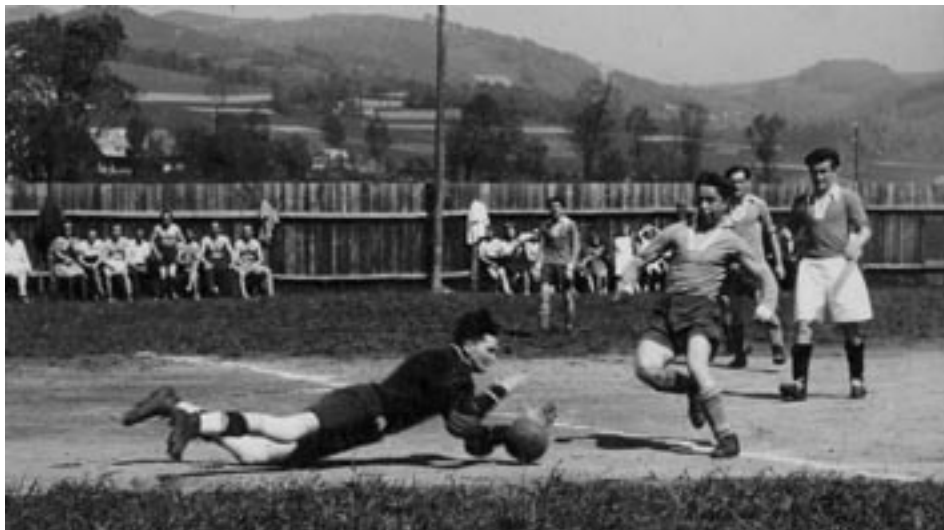
Z počátků TJ Bystré

To je velký příslib do budoucnosti. Těší mě, že i přes velkou konkurenci jiných sportů a aktivit si našli cestu k nám. Velkou měrou k tomu přispívá i skvělé zázemí naší tělovýchovné jednoty.