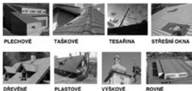
PLECHOVÉ TAŠKOVÉ TESAŘINA STŘEŠNÍ OKNA DŘEVĚNÉ PLASTOVÉ VÝŠKOVÉ ROVNÉ