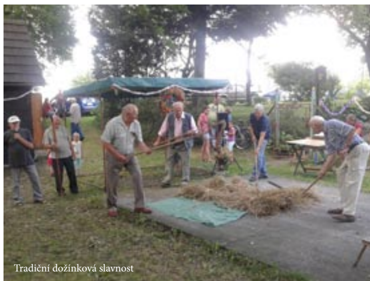
Tradiční dožínková slavnost