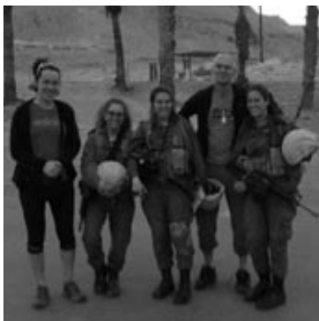
Spolu s manželkou a izraelskými vojačkami v Negevské poušti

Na strojích obdivuji jejich estetickou krásu hraničící často s dokonalostí. S tím se pojí znalost příběhů kolem létání. Některé jsou tak neuvěřitelné a zajímavé, že vydají na skvělý beletristický román. Vemte si například, že první motorový let aeroplánu bratří Wrightů v roce 1903 trval 49 sekund