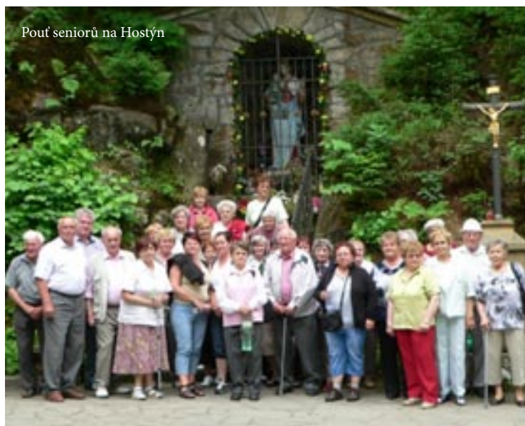
Pouť seniorů na Hostýn

Obecní noviny z Trojanovic - periodický tisk územního samosprávného celku - MK ČR E 22401 • vychází měsíčně • číslo vyšlo 1. 9. 2016 v nákladu 950 ks • vydává: Obec Trojanovice, Trojanovice 210, 744 01 Frenštát p. R., IČ 00298514 • • tisk: ARUNDO TRADING, s.r.o. • titulní strana: Pavel Rampír - Spitfire v oblacích • Uzávěrka příštího čísla bude 20. září 2016, své příspěvky můžete zasílat na: obecni.noviny@trojanovice.cz