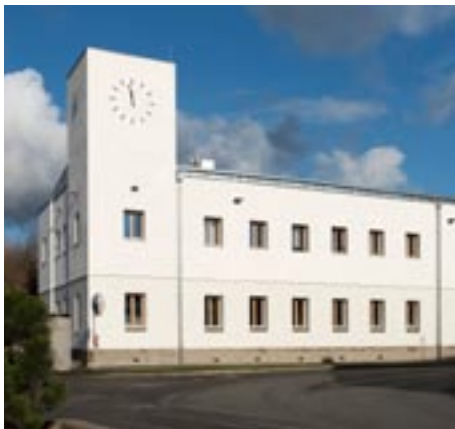
Dům služeb v Líbeznicích u Prahy