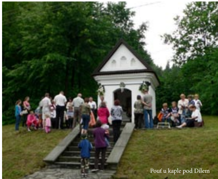
Pouť u kaple pod Dilem