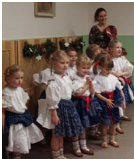
Děti z MŠ Trojanovice

Adventní období v Domově bylo nabité bohatým kulturním a společenským programem. Program začal půvabným vánočním pásmem z MŠ Školská, které děti zakončily předáním háčkovaných srdíček.