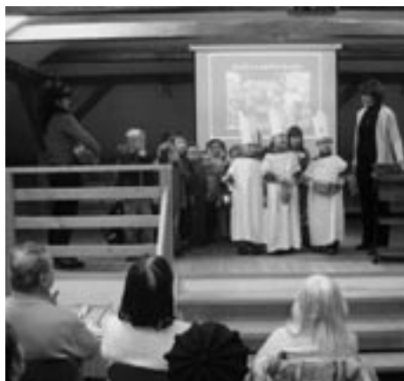
Setkání čtvrtečníků zpestřilo tříkrálové vystoupení žáků z MŠ Dolní ve Frenštátě p. R.

Projekt jsme zahájili v březnu loňského roku. Uplynulou dobu, během které proběhlo celkem 7 setkání, jsme chápali jako zkušební. Zaznamenali jsme řadu cenných připomínek, na jejichž základě jsme se rozhodli upravit dosavadní praxi. Mnozí návštěvníci si postesklí, že by se přednášek a besed rádi zúčastnili, ale nevyhovuje jim dopolední čas jejich konání. Jiní si naopak pochvalovali, že mohou přijít do muzea „za světla“. Rozhodli jsme se tedy besedy