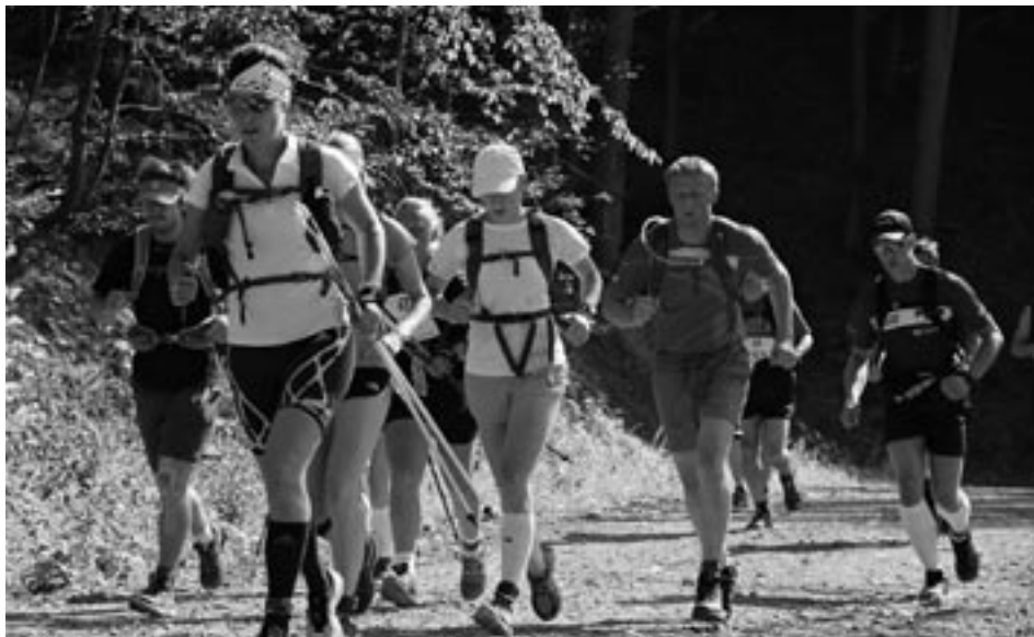
Během Slezského maratonu

Posledních pár let už čtu jen turistické průvodce a na netu blogy o cestování a sportu. Hudbu většinou poslouchám jen při závodech a to české a slovenské interprety,