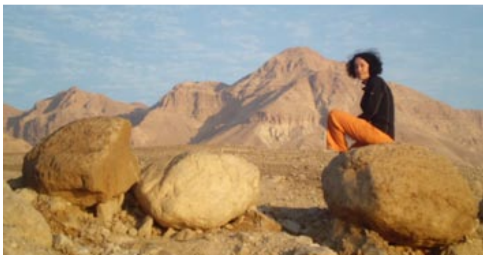
V Negevské poušti v Izraeli

Mohu odbočit od tématu? Co ráda čtete a jakou hudbu ráda posloucháte?