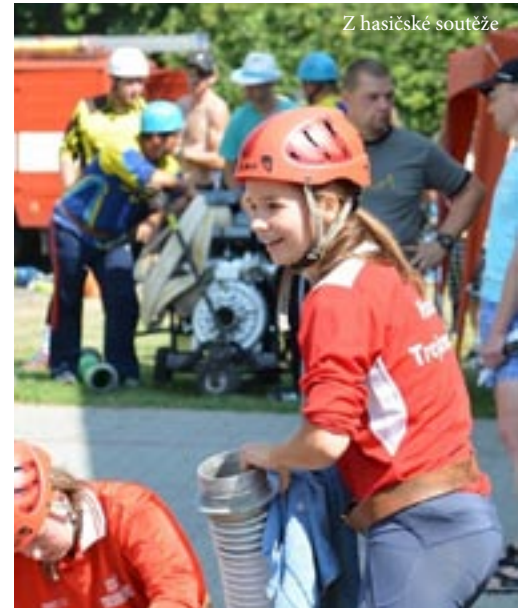
Z hasičské soutěže