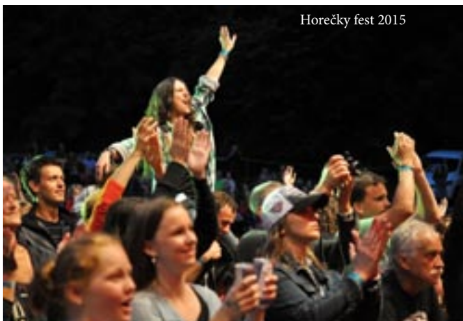
Horečky fest 2015