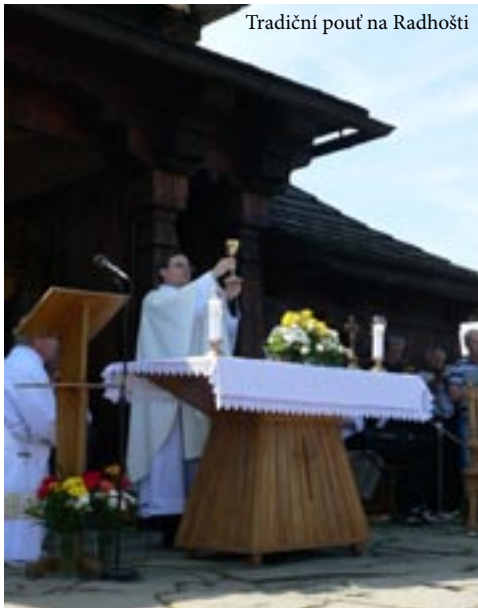
Tradiční pouť na Radhošti