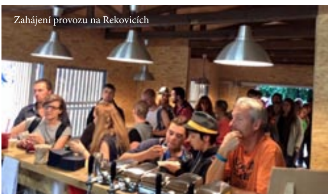
Zahájení provozu na Rekovicích