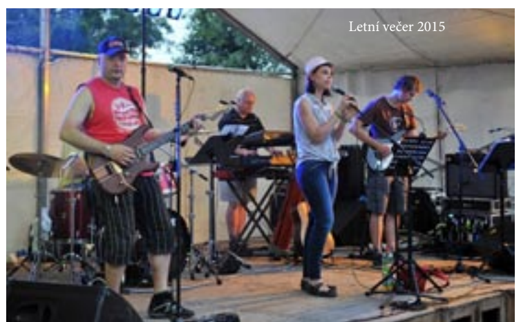
Letní večer 2015

Uzávěrka příštího čísla bude mimořádně 15. září 2015 , své příspěvky můžete zasílat na: obecni.noviny@trojanovice.cz vychází měsíčně • redakce: Obecní úřad Trojanovice • vydává: ARUNDO TRADING, s.r.o. • titulní strana: Lenka Kaiserová - Perleťovec stříbropásek v Trojanovicích