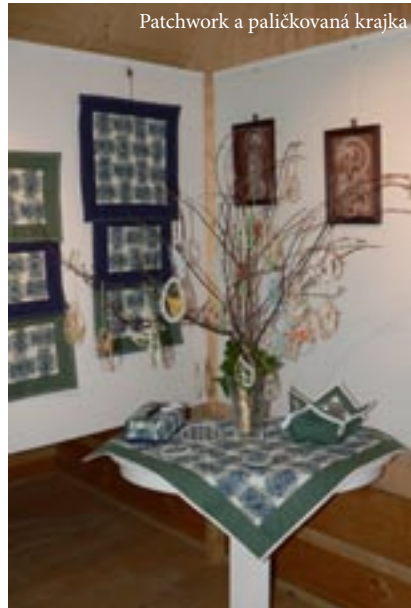
Patchwork a paličkovaná krajka