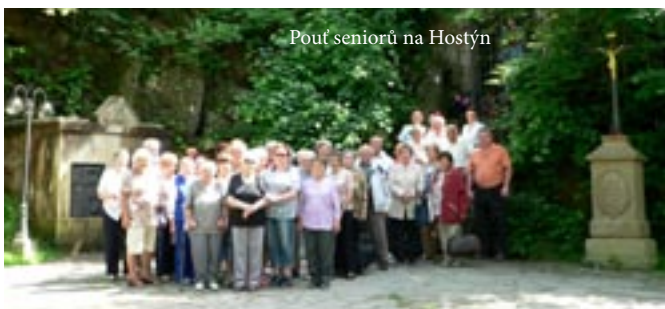
Pouť seniorů na Hostýn