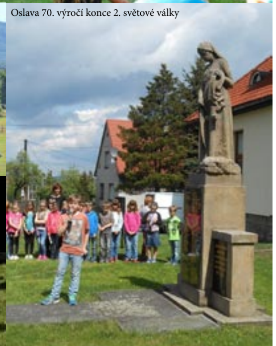
Oslava 70. výročí konce 2. světové války