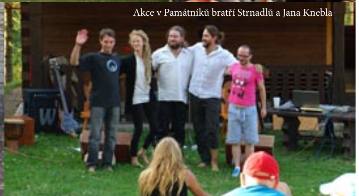
Akce v Památníku bratří Strnadlů a Jana Knebla