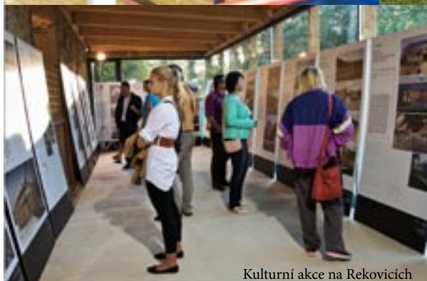
Kulturní akce na Rekovcích