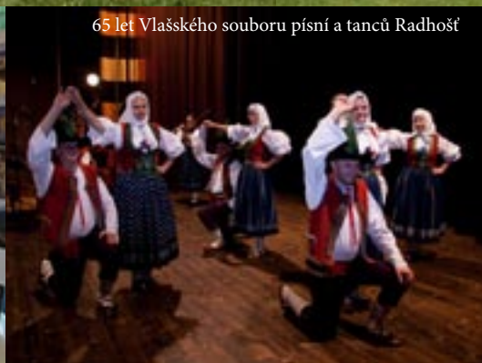
65 let Vlašského souboru písní a tanců Radhošť