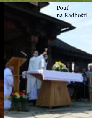
Pouť na Radhošti

Uzávěrka příštího čísla bude 20. prosince 2015, své příspěvky můžete zasílat na: obcni.noviny@trojanovice.cz vychází měsíčně • redakce: Obecní úřad Trojanovice • vydává: ARUNDO TRADING, s.r.o. • titulní strana: Martin Buryan - Cestou na Pustevny