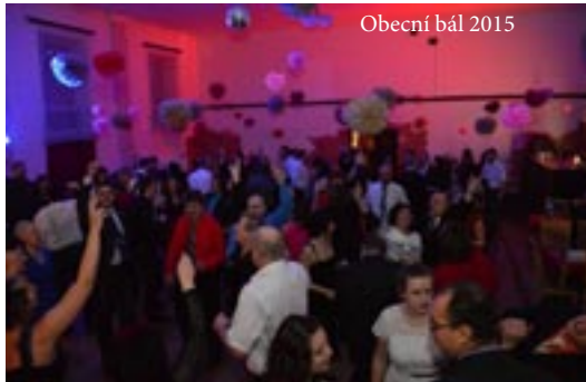
Obecní bál 2015