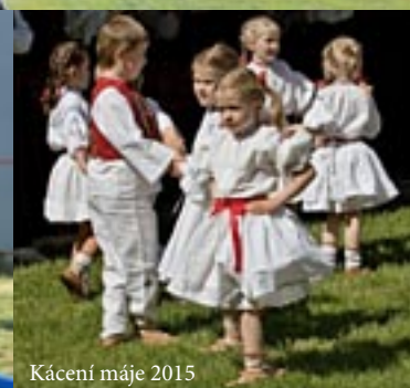
Kácení máje 2015