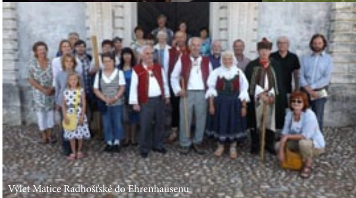
Výlet Matice Radhoštěské do Ehrenhausenu