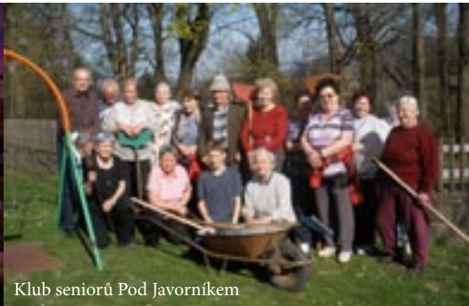
Klub seniorů Pod Javorníkem