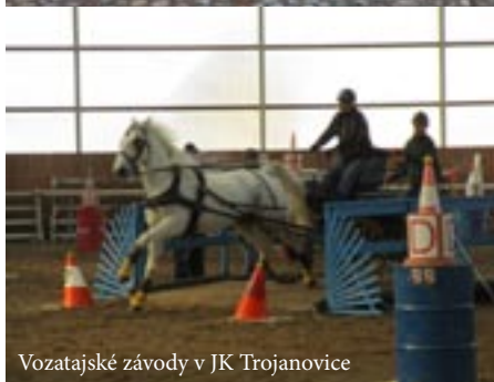
Vozatajské závody v JK Trojanovice