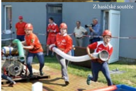
Z hasičské soutěže