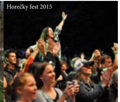
Horečky fest 2015