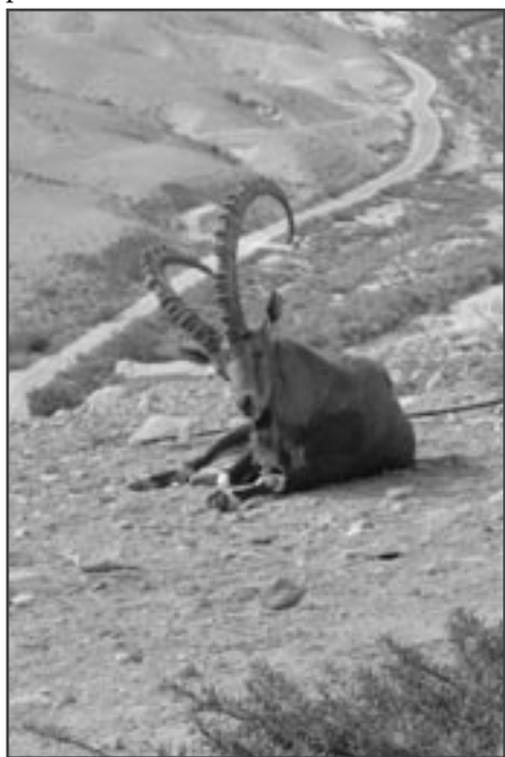
Samec kozorožce nubijského ( Capra nubiana )

Negevská poušť je místem, kde se nachází podniky, jejichž provoz je spjatý s rizikem – jaderné i tepelné elektrárny, ropu zpracovávající koncerny, armádní cvičné prostory, věznice. Najdete zde centra na výrobu solární energie i vinařské oblasti, ve kterých se využívá nejmodernější zavlažovací technologie. Nachází se tu řada kibuců – zvláštních osad s kolektivním způsobem hospodaření. Sídli tu Univerzita Davida Ben Guriona, jejíž výzkum se zaměřuje na využití potenciálu pouštní oblasti. To vše je důkazem, jak houževnatost a důmyslnost dokázaly zvítězit nad nepřízní přírodních podmínek.