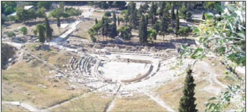
Dionýsovo divadlo pod athénskou Akropolí bylo místem, kde se ve starověku hrávaly Sofoklovy hry

Řecké divadlo se vyvinulo z náboženských oslav na počest boha Dionýsa, tzv. dionýsií . Během nich se konaly průvody městem, které byly provázeny zpěvem, hudbou a živými obrazy. Zpočátku dramatické texty přednášely sbory. Z jejich středu se postup-