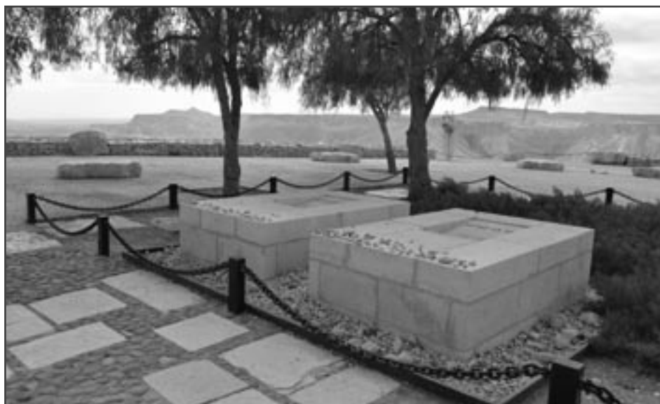
Hrob Davida Ben Guriona a jeho ženy Pauly

Kibuc Sde Boker je místem, kde žil a je pochován David Ben Gurion (1886-1973). Tento muž zasvětil svůj život vytvoření samostatného židovského státu. V roce 1948 se stal jeho prvním ministerským předsedou a s přestávkou setrval v této funkci až do roku 1963. Za jeho vlády země dvakrát vstoupila do války se svými arabskými sousedy. Složitost existence státu Izrael sám vystihl těmito slovy: „Kdybych byl arabským