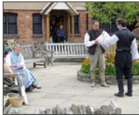
Vystoupení na dvoře Shakespeareova rodného domu

O Shakespeareovo dílo je dodnes stále vedeno několik sporů, zdali byl autorem, nebo pouze dobře vytvořenou a prodávanou reklamou. Ať už tedy věříme, čemu chceme, je nesporné, že je jedním z nejznámějších a dosud nejhranějších a nejoblíbenějších autorů všech dob, který má v Česku i svůj putovní festival, pravidelně vyprodán několik měsíců dopředu.