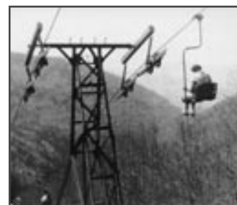
Druhá generace lanovky