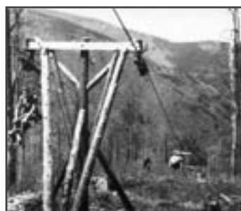
První generace lanovky