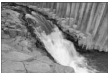
Koryto říčky Mešušin

Sedíme v autě, právě jsme přejeli Jordán a za zády máme Galilejské jezero. Míříme do podhůří Golan. V obecném povědomí žijí Golanské výšiny jako nebezpečná, válkou rozvrácená oblast, kde se snadno můžete stát obětí nášlapné miny či raketového útoku. Při této pověsti není divu, že tu není „přeturistováno“. Nechci zlehčovat. Golany skutečně mají za sebou pohnutou minulost. Po vzniku státu Izrael v roce 1948 se tu nejprve opevnili Syřané. Celou oblast záhy proměnili v jednu velkou odpalovací rampu pro rakety namířené na severní oblasti Izraele. Golanské pohoří s nejvyšším vrcholem Mont Hermon (2814 m. n. m.) je klíčové ještě z jednoho hlediska. Na jihozápadních svazích zmíněné hory se nachází pramenná oblast Jordánu, řeky, která zásobuje Izrael vodou od Galilejského jezera až k Mrtvému moři. V této jinak suché oblasti je voda strategickým zdrojem jako např. pro nás ropa. Proto se Golany staly předmětem dvou válečných konfliktů (šestidenní a jomkipurská válka), po kterých přešly do rukou izraelské armády. V roce 1981 pak Izrael celou oblast jednostranně anektoval. Od té doby jsou sice Golany pod izraelskou kontrolou, existence tu je však nejistá.