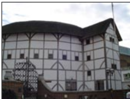
Divadlo The Globe znovu vybudované v r. 1997

Sám Shakespeare vstoupil do divadelního života jako herec v roce 1582. O témě