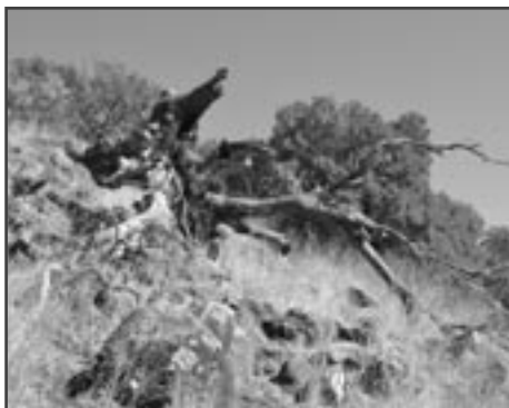
Bylinná vegetace je v říjnu většinou suchá a spálená

Zastavujeme u návštěvnického centra přírodní rezervace Jehudija, dostáváme mapu a přesné pokyny a vyrážíme k lokalitě Mešušinských jezer. Jde o systém malých přírodních rezervoárů v toku stejnojmenné říčky, která prudce stéká z náhorní plošiny do údolí Galilejského jezera, zařezává se do čedičových svahů a vytváří působivý miniaturní kaňon. Kraj byl osídlen již ve starší době bronzové (3.-2. tisíciletí př. n. l.), o čemž svědčí i náhrobní dolomenné nedaleko vstupu do rezervace.