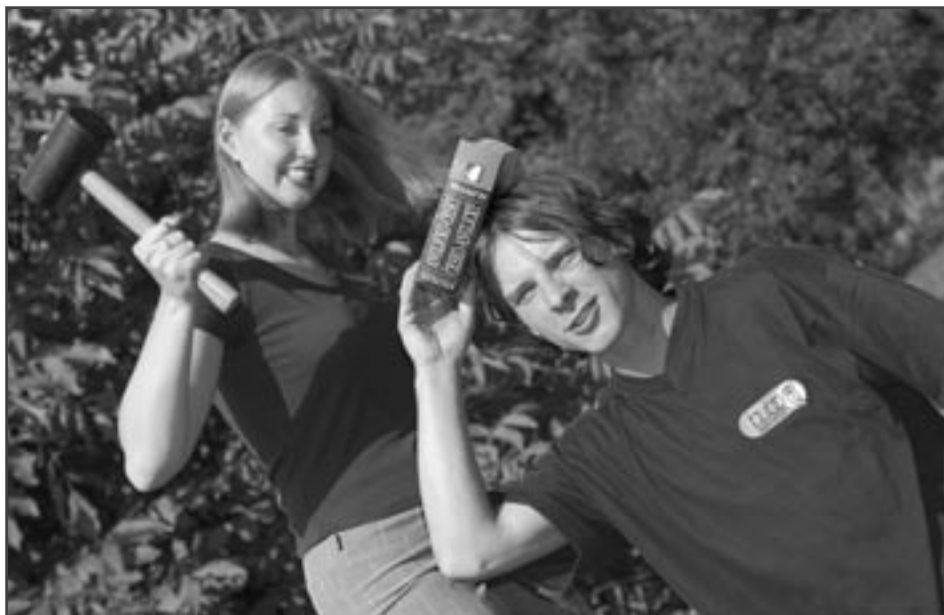
Metoda vtluokací - drsná, ale účinná.

dlouho by se dokázali naučit čínsky. Nejdříve se ptali vysokoškolského profesora s několika tituly před i za jménem, který odpověděl, že asi 4 až 5 let. Další byl na řadě asistent, ten si věřil více a řekl, že tak 2 až 3 roky. Třetím byl mladý inženýr s krátkou praxí ve fabrice. Odpověděl: „Myslím, že rok až dva by mi stačily.“ Poslední byl student druhého ročníku na vysoké škole a z toho místo odpovědi vypadlo: „A kdy bude zkouška?“