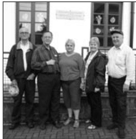
V Trojanovicích před pamětní deskou věnovanou vystěhovalcům do Texasu