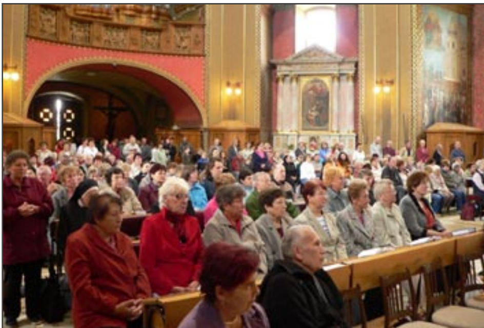
Ve 13.00 hodin se konalo v bazilice svá-

Po mši svaté se někteří zúčastnili pobožnosti křížové cesty, kterou jsme se letos modlili podle amerického arcibiskupa Fultona Sheena. Ten nás nabádá např. k takovému zamyšlení: „Proč je na světě bolest? Proč si myslíme, že Ježíš nás kompromituje ve společnosti? Kazí mladým kariéru? Proč si někdy myslíme, že to nějak půjde i bez něj?“ Na závěr křížové cesty jsme poděkovali za myšlenky a náměty pro náš pozemský život.