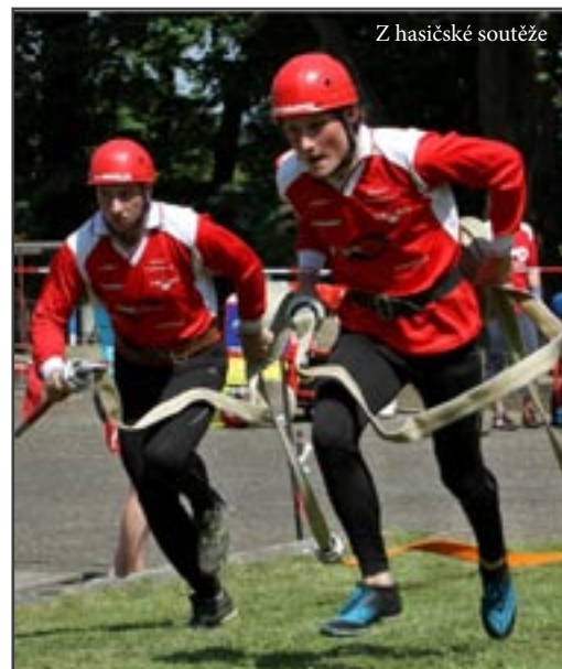
Z hasičské soutěže