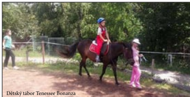
Dětský tábor Tennessee Bonanza