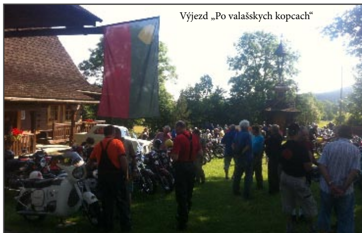
Výjezd „Po valašských kopcach“