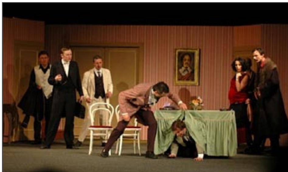
Z komedie G. Feydeaua: Brouk v hlavě