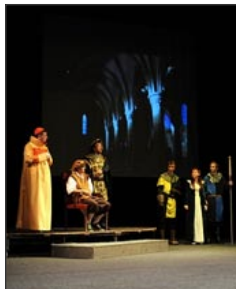
Ze hry G. B. Shawa: Svatá Jana

umělecké a intelektuální prostředí. Jeho hry hraničí s naturalismem, ale na rozdíl od jeho současníků Shaw píše optimisticky, vnáší do svých děl nadhled a komiku, zároveň kritizuje a analyzuje společnost. Jeho současníkem byl i anglický spisovatel irského původu Oscar Wilde, který svá díla považoval za skutečnější než skutečnost samu (dle svých slov). Společnost rád bavil svými vymyšlenými příběhy, kdy sledoval jejich reakce (potřeboval jejich zpětnou vazbu). Nejdůležitější pro něj byl vývoj hrdiny během hry nikoliv děj. Sám pak zastával názor, že člověk by měl svůj život žít jako umělecké dílo.