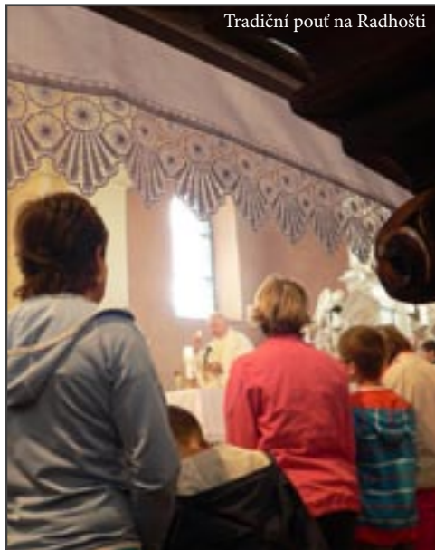
Tradiční pouť na Radhošti