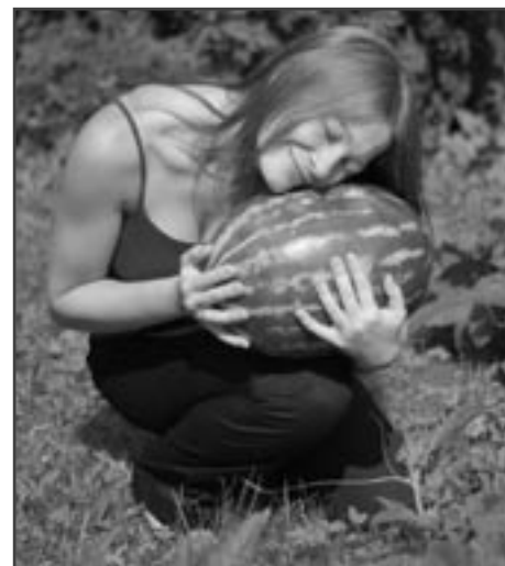
Každý se těší na plody své práce.

Co můžeš udělat dnes, neodkládej na zítřek. Toto přísloví se teď nabízí samo. Když to učení nemůžete odložit na zítřek, poučení předchozím odstavcem, zkoušíte je odložit alespoň na později. Problémem při učení je mnohdy jen najít si chvíli. Hledáme optimální čas a místo na učení. Přitom ale nevědomky vyhledáváme činnosti, které jsou zdánlivě důležitější než začneme s učením. A říkáte si: „Pošlu děti ven, ať mám klid. Konečně je klid, ale ještě umyju to nádobí a pak už se do toho učení dám. Nádobí je umyto, ještě ten koš a jdu na to. Koš je vyneseno a co to běží v televizi? Scénka s Menšíkem a Bohdalovou, no tak pro pět minut se snad ještě tak moc