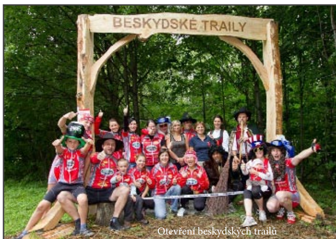
Otevření beskydských trailů