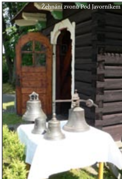
Žehnání zvonů Pod Javorníkem