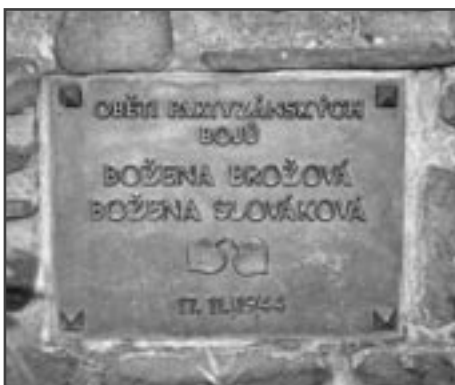
Pamětní deska obětem listopadových událostí