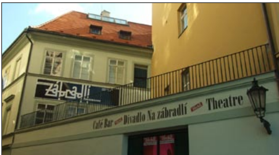
Průčelí Divadla Na zábradlí v Praze

Absurdní divadlo se postupně vyvinulo ze surrealismu. Absurdní hra většinou nebývá srozumitelná po jednom přečtení, ale je třeba ji přečíst (nebo vidět) vícekrát a ani tehdy nám není zaručeno, že hru pochopíme, nebo si alespoň něco málo zapamatujeme. V drtivé většině je třeba se na hru daného směru výrazně soustředit, neboť není výjimkou, že se střídají vypravěči, děj se vrací ze současnosti do minulosti a naopak skáče do budoucnosti. Je silně potlačena dějová stránka, autoři se hojně zabývají vnitřními světy postav, jejich myšlenkami a představami. Absurdní divadlo čerpá zpravidla ze čtyř odvětví – z tzv. čistého divadla (bere scénické efekty z cirkusu, revue, mimických představení) a zaujímá aliterární postoj, tzn. odvrací se od jazyka a znehodnocuje jej, neboť se snaží dokázat, že komplikuje chápání. Dalším odvětvím jsou žerty klaunů a šašků (groteska a filmové veselohry), slovní nesmysly a postavy groteskně snivé a inspiraci si bere také ve snově a fantaskní literatuře. Extrémní a poměrně častou formou světového absurdního divadla pak bylo ztvárnění utrpení a to v jakékoliv podobě, nejčastěji však psychické. Začaly se objevovat postavy vyšinuté, perverzní, autoři a inscenátoři šli do šokujících krajností, které obecnost mělo znechutit a pobouřit. Herec byl pouze lout-