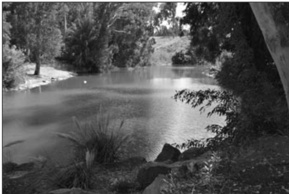
Řeka Jordán v Jardenitu

A tu jsme je spatřili. V teplé prosluněné mělké vodě, několik metrů od „koupáčů“, líně se povalovali urostlí sumci. Přesněji řečeno keříčkovci ( Clariidae ). Keříčkovci jsou čeled' z řádu sumcovitých ryb. Tvoří ji zhruba 100 druhů výlučně sladkovodních ryb obývajících řeky a jezera na Blízkém Východě, v Malajsii, jihovýchodní Asii a Africe včetně Madagaskaru. Mají torpédovité tělo bez šupin. Hřbetní a řitní ploutve jsou protáhlé, často srůstají s ocasní ploutví a vytvářejí ploutevní lem. Kolem úst mají čtyři páry dlouhých vousů. Svůj český název získala skupina podle zvláštních keříčkovitých útvarů vyrůstajících na žaberních obloučích. Tyto přídatné dýchací orgány umožňují některým druhům keříčkovců dýchat atmosférický kyslík. Tak mohou tyto ryby přežít i nepříznivé období, kdy je vody nedostatek, ukryté v bahně. Dokonce mohou nakrátko zcela opustit vodní prostředí a na krátké vzdálenosti migrovat