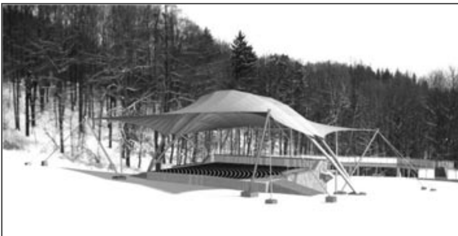
Návrh nové podoby amfiteátru na Horečkách

Celý projekt obsahuje mimo jiné zastřešení amfiteátru na Horečkách prostřednictvím vzdušné konstrukce imitující oblohu, na které jsou vidět siluety dravých ptáků. Vznikne také téměř 100metrová lávka v korunách stromů, začínající přímo za budovou amfiteátru nad roklí potoka Vlčák budou lidé až 15 metrů nad terénem. Autor projektového záměru Marian Žárský řekl: „Spojit unikátním způsobem kulturní zařízení jako je amfiteátr a naučnou stezku byl nápad, který se zrodil už před několika lety. Zaměření na dravé ptáky, jejichž dřevěné siluety se budou vznášet pod klenbou střechy pódia, není náhodné. Při tvorbě projektu jsme konzultovali záměr se Záchrannou stanicí ohrožených živočichů v Bartošovicích a také s odborníky z Chráněné krajinné oblasti Beskydy. Na lávce v korunách tak vznikne celkem 6 zastave-