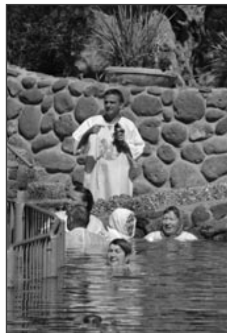
Pocit očisty, zážitek smrti nebo návrat k počátkům?