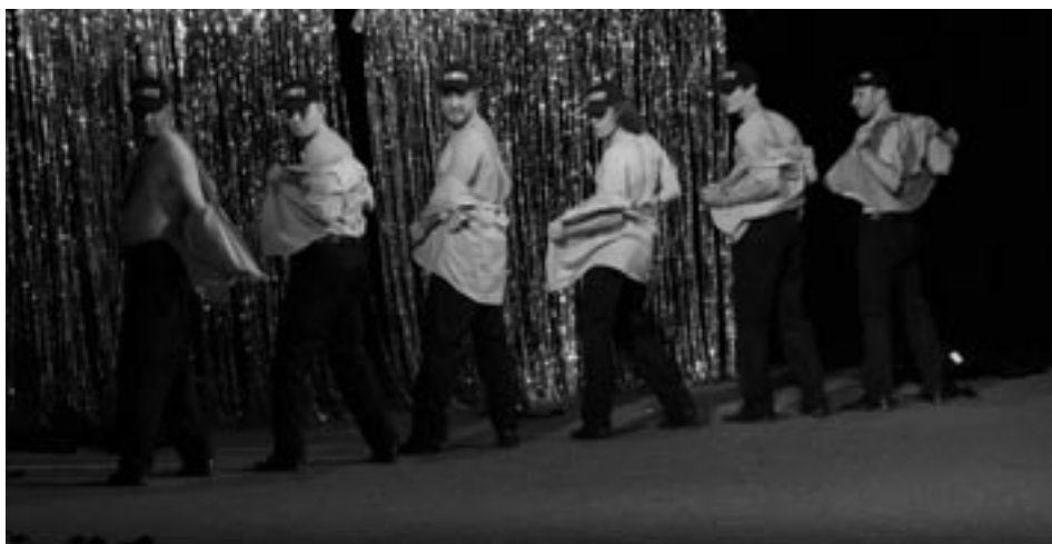
Z představení Donaha

syna a snaží se dohnat k zodpovědnosti i svého bývalého muže.