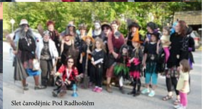
Slet čarodějnic Pod Radhoštěm