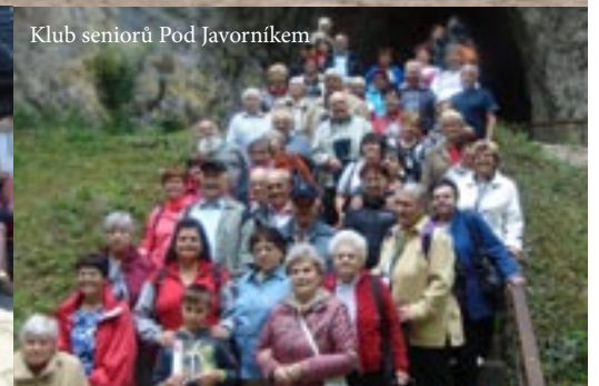
Klub seniorů Pod Javorníkem