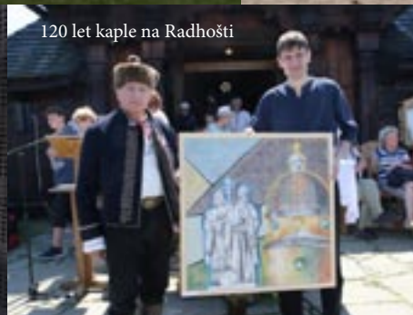
120 let kaple na Radhošti