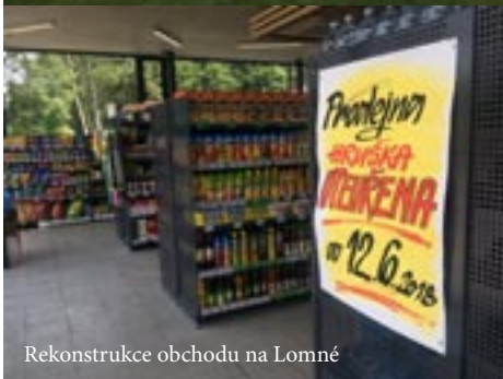
Rekonstrukce obchodu na Lomné