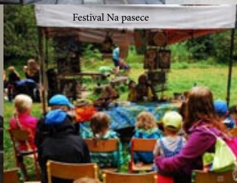
Festival Na pasece