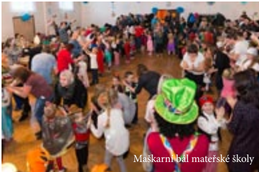
Maškarní bál mateřské školy