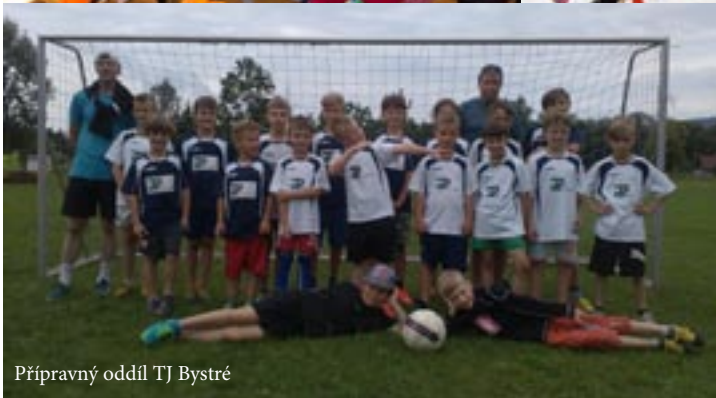
Přípravný oddíl TJ Bystré