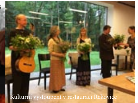
Kulturní vystoupení v restauraci Rekovice