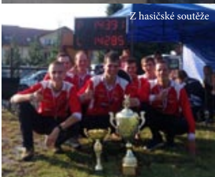
Z hasičské soutěže