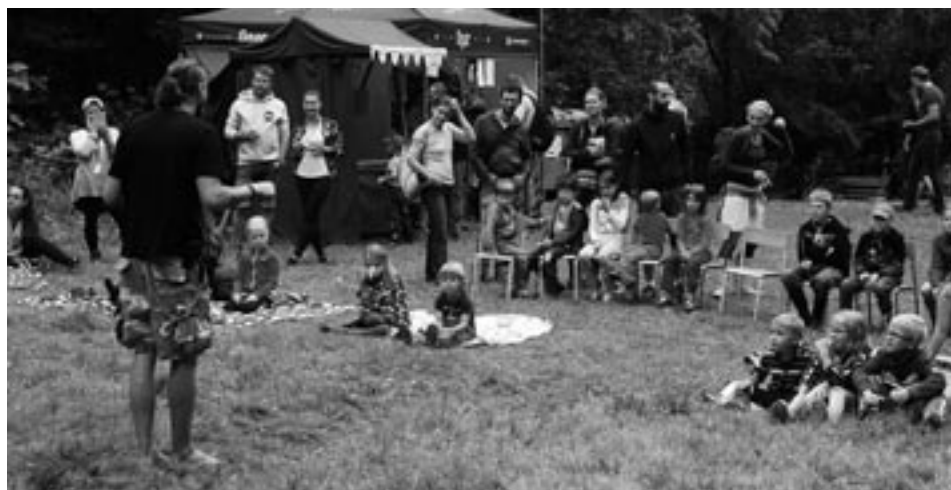
Z letošního hudebního a divadelního festivalu, který pořádal klub Na pasece