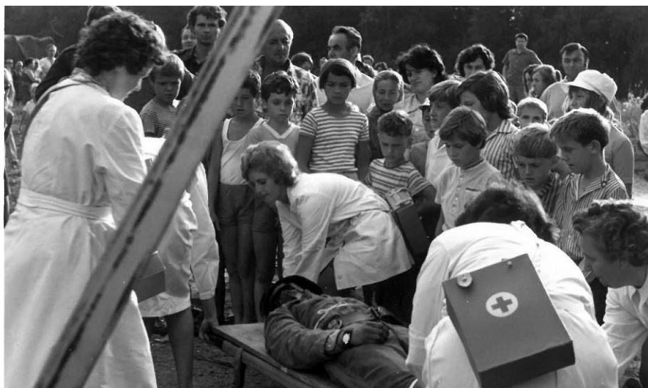
ČSČK 18.8.1973, námětové cvičení u hotelu Banka