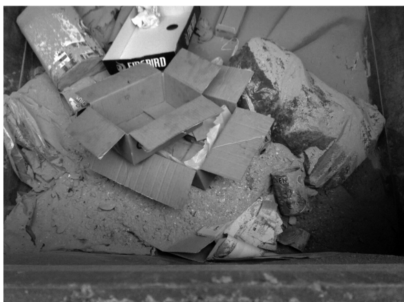
Foto obsahu modrého kontejneru na papír: suť, plechovky od barev, pytle se směsným odpadem, znečištěné krabice. Bohužel i takto si někteří lidé představují TRÍDĚNÍ odpadu.