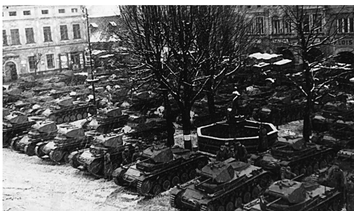
Oba snímky zachycují frenštátské náměstí obsazené německou armádou 1939