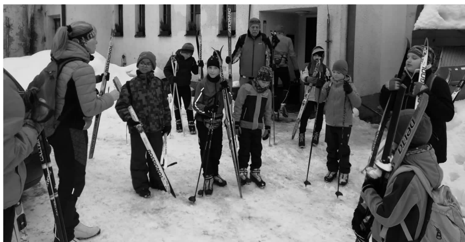
Nástup oddílu u hotelu Potocký a závěrečné pokyny před přesunem do bílé stopy