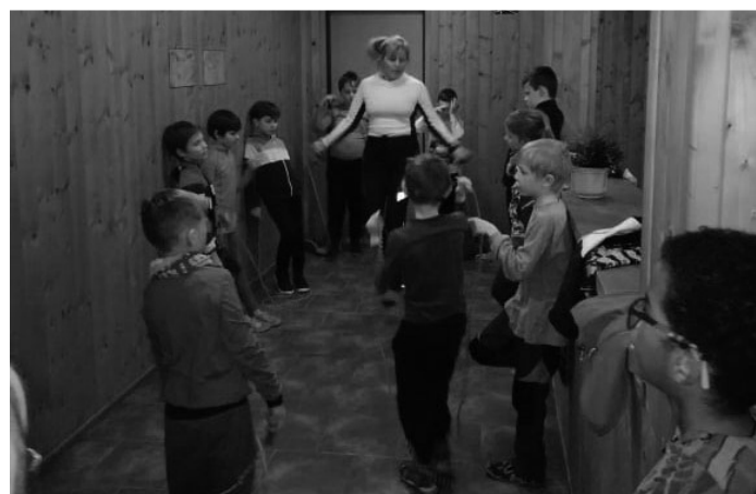
Nácvik skoku přes švihadlo, názorná ukázka p.učitelky