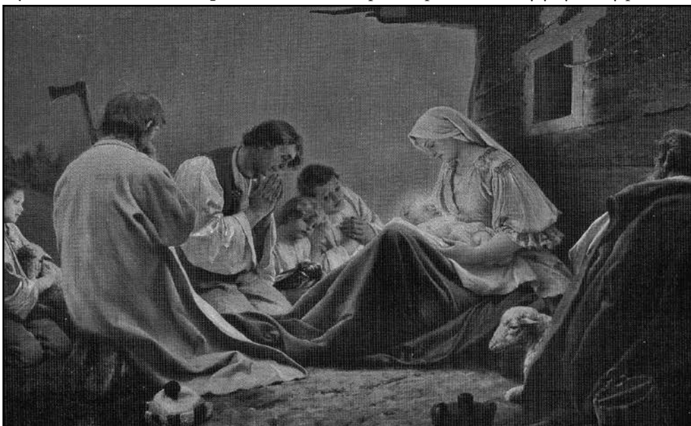
Valašská Madona - zde je pouze střední část obrazu, která představuje „Klanění pastýřů“. Na bočních částech triptychu jsou: „Cesta do Betléma“ a „Zvěstování pastýřům“.

V té době se členové právě vzniklého výboru pro výstavbu cyrilometodějské kaple na Radhošti potýkali s nedostatkem financí pro zabezpečení takového díla. Zlom přinesl nápad zakoupit od malíře Liebschera obraz Valašská Madona a pořádat s ním putovní výstavy po moravských i českých městech, spojené se sbírkou ve prospěch kaple. Zároveň byly vytištěny pohlednice s reprodukcí obra-