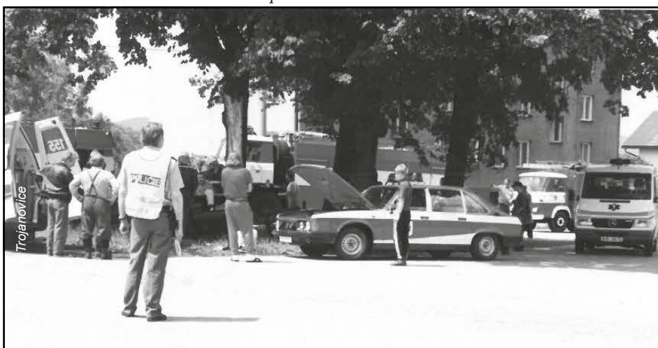
Při smrtelné nehodě 10.7.1997 vyhasl nejen jeden život, ale nárazem utrpěla i jedna z lip. Následkem nejen této nehody lípa uschla a větrem se zlomila.