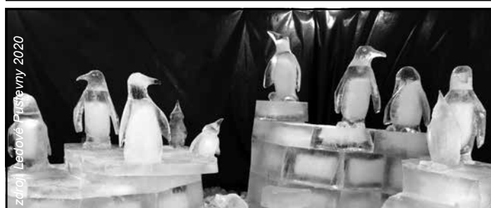
zdroj: Ledové Pustevny 2020

Obecní noviny z Trojanovic - periodický tisk územního samosprávného celku - MK ČR E 22401 • vychází měsíčně • číslo vyšlo 4. 2. 2020 v nákladu 1200 ks • vydává: Obec Trojanovice, Trojanovice 210, 744 01 Frenštát p. R., IČ 00298514 • • tisk: ARUNDO TRADING, s.r.o. • foto: Martina Jurková - Ledové Pustevny 2020 •