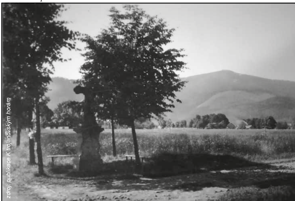
Kříž Na Lomné kolem roku 1930. V pozadí Radhošť.