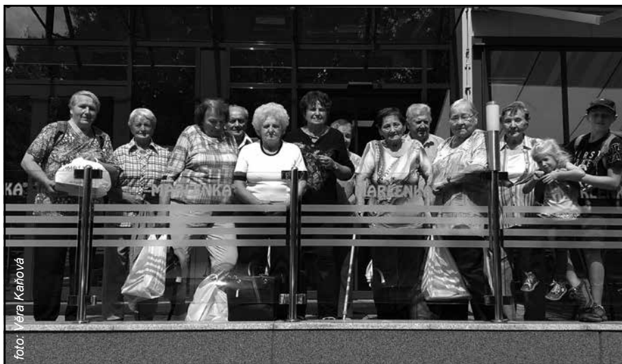
Návštěva výroby medových dortů Marlenka srpen 2019