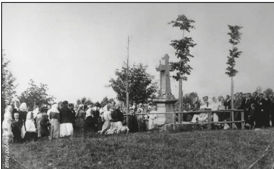
Svatodušní pobožnost u kříže Na Lomné v roce 1925.

Lípy rostly a staly se živoucí připomínkou historické události nabytí svobody československého národa. Život má však svůj začátek a konec. Ze sester, jejichž tenké kmín-